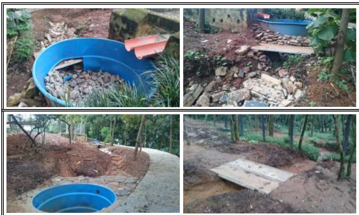
Figura 4a,b,c e d. Fotos de dispositivos para desaceleração e infiltração de água de chuva.

2 – TCs mistas com dispositivos de desaceleração e infiltração (DDI) de água de chuva utilizando materiais reaproveitados.