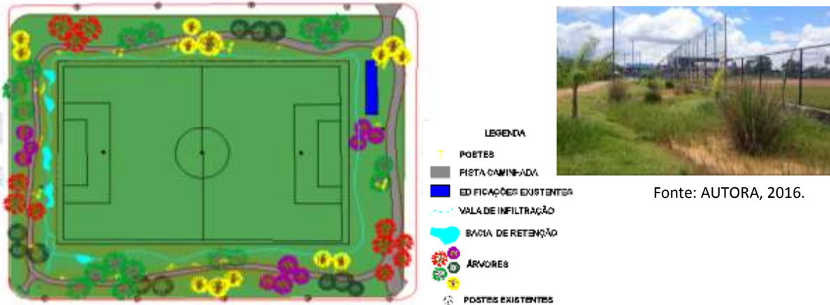
Figura 3a e b: Planta baixa da área de lazer do Campo do Caxias e foto de bacia com acúmulo de água de chuva do dia anterior.