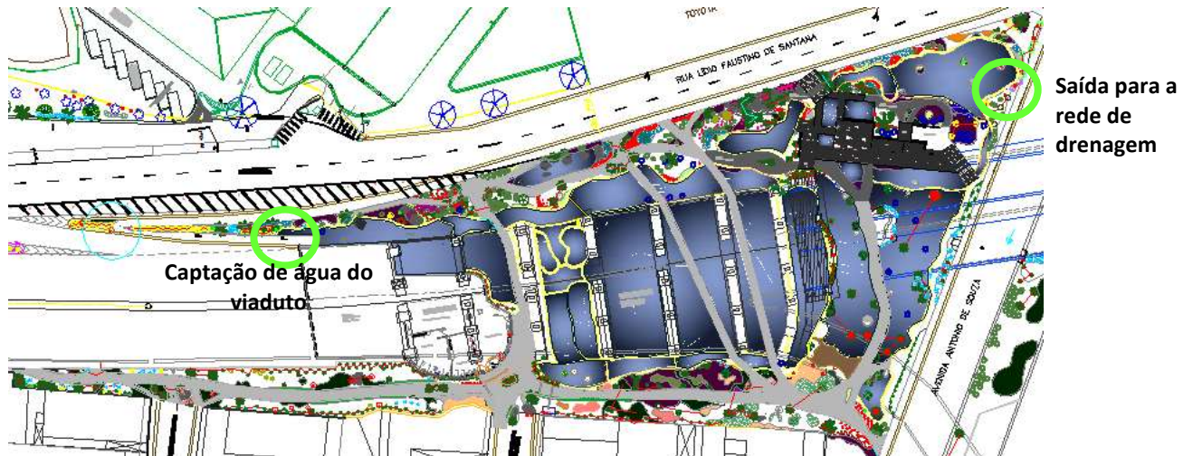
Figura 9. Planta do projeto de paisagismo com espelhos d'água sob Viaduto Cidade de Guarulhos.