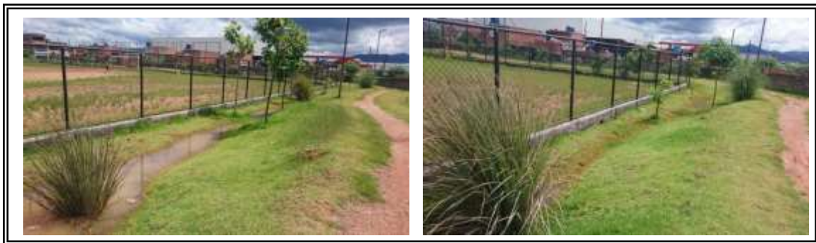
Figura 2a e b. Trecho da vala de infiltração junto a campo de futebol. Úmida e seca.

1 -Valas de infiltração (VI) de águas pluviais provenientes da drenagem do campo de futebol.