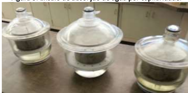
Figura 3: Ensaio de absorção de água por capilaridade.

Conforme define a NBR 9779, para análise de composições do concreto, foram utilizados 3 corpos de prova, com volume de 2500 cm 3 cada.