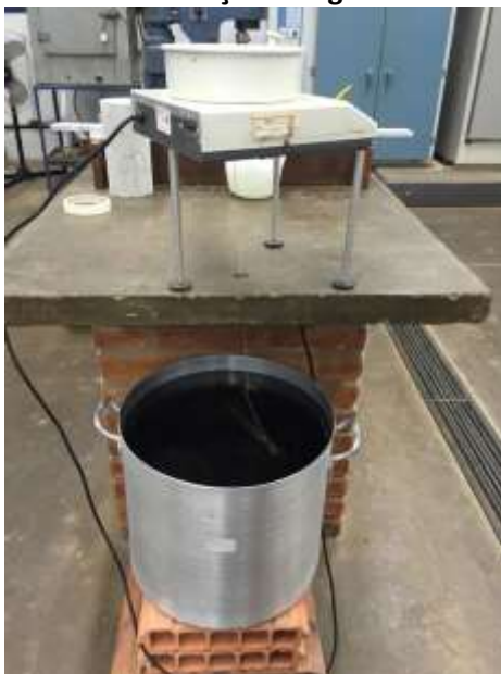
Figura 2: Ensaio de absorção de água e índice de vazios.

Para realizar esse teste, conforme a NBR 9778, foram utilizados dois corpos de prova de cada dosagem.