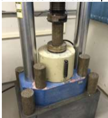
Figura 4: Ensaio de resistência à compressão.