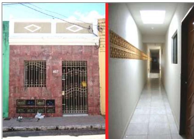
Figura 09: Grupo de leitores de energia elétrica na fachada de uma HCPA localizada no Varadouro.

Outra indicação obtida nas fachadas de diversos exemplares de HCPAs é o amontoado de leitores de água e/ou luz, existente apenas quando os locadores individualizam esses serviços, fazendo com que cada locatário pague suas próprias contas (ver figura 09). Este indício não é tão frequente, tendo em vista que a individualização dos serviços de água e energia elétrica é dispendiosa para os proprietários de habitações coletivas, entretanto, não se deve deixar de citá-lo.