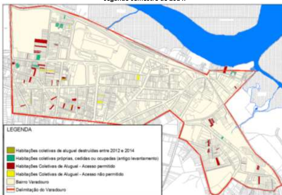
Figura 02 - Levantamento das habitações coletivas precárias de aluguel do bairro Varadouro desenvolvido no segundo semestre de 2014.