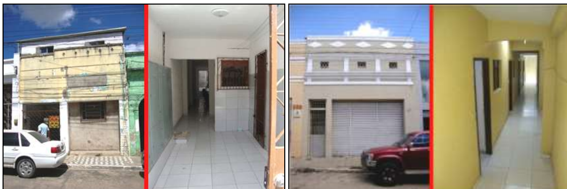
Figuras 07 e 08: Exemplos de descaracterização da fachada de um casario da área central de João Pessoa, que funcionam como habitação coletiva precária de aluguel.

Assim, a fachada aparece como um artifício que não sugere prenúncio, que não atrai a imaginação de como se configura a parte posterior da edificação (PARIS, 2013). O interior fica em segundo plano não só no imaginário dos transeuntes nas ruas, mas também na legislação municipal, cuja preocupação se restringe apenas à aparência das fachadas dos edifícios situados nas áreas centrais brasileiras. Através da fachada, inúmeros indícios revelam para os olhares atentos que a edificação se trata de uma habitação coletiva de aluguel. Um dos rastros identificados em algumas HCPAs é a má conservação de suas antigas fachadas e até mesmo a descaracterização de sua arquitetura, como se pode ver nas figuras 07 e 08.