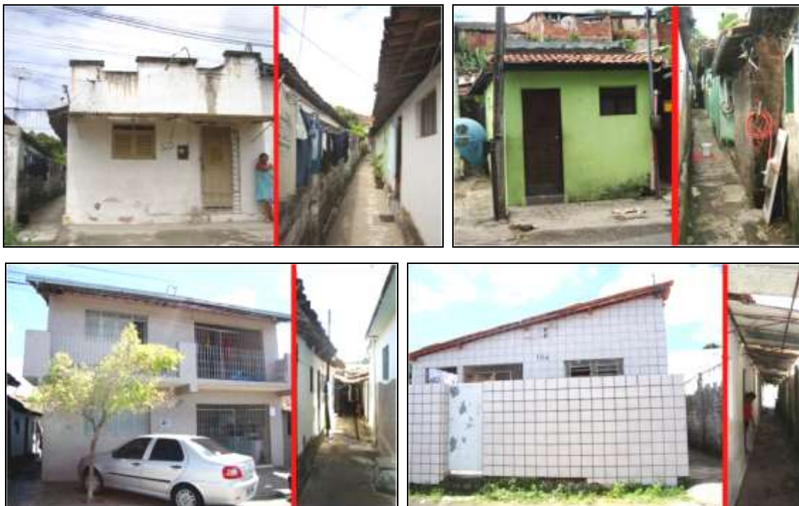
Figuras 03 a 06: Exemplares de HCPAs localizadas em diversas ruas do bairro Varadouro invisibilizadas devido à aparência de habitação unifamiliar das fachadas principais de seus edifícios.

Por serem edificações unifamiliares na maioria dos casos, tais habitações passam despercebidas na paisagem urbana, tendo em suas fachadas um bom “disfarce” para a precariedade, miséria e inadequação habitacional a que estão sujeitos seus moradores (figuras 03 a 06). Em contraponto, tornam-se visíveis quando há interesse do capital imobiliário na área onde estão inseridas, e seus moradores são os primeiros a serem remanejados ou até expulsos, como nos mostra a história da habitação popular nas áreas centrais urbanas.