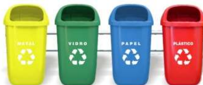
Figura 1: tipos de reciclagem

No Brasil, as lixeiras para dispor materiais recicláveis adotam o subsequente padrão (figura 1):