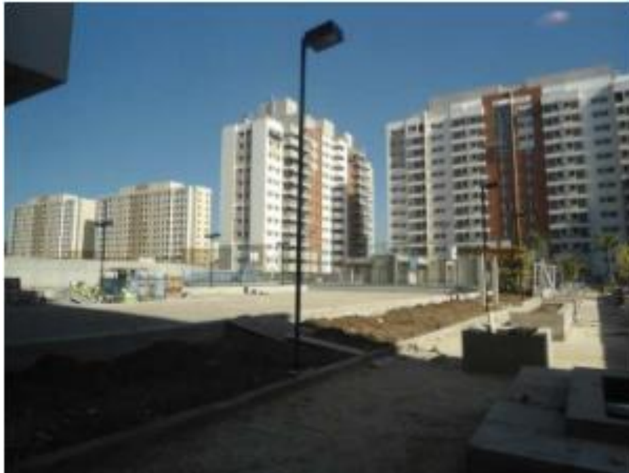
Figura 4: Prédios residenciais junto à estação Vicente Carvalho