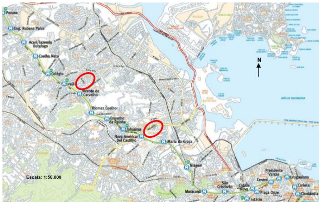
Figura 1: Mapa das estações Nova América/Del Castilho e Vicente de Carvalho.

A figura 1 mostra as estações Nova América/Del Castilho e Vicente de Carvalho (zona Norte da cidade), estando as duas regiões em destaque, sendo que essas regiões foram alvo de muitos investimentos.