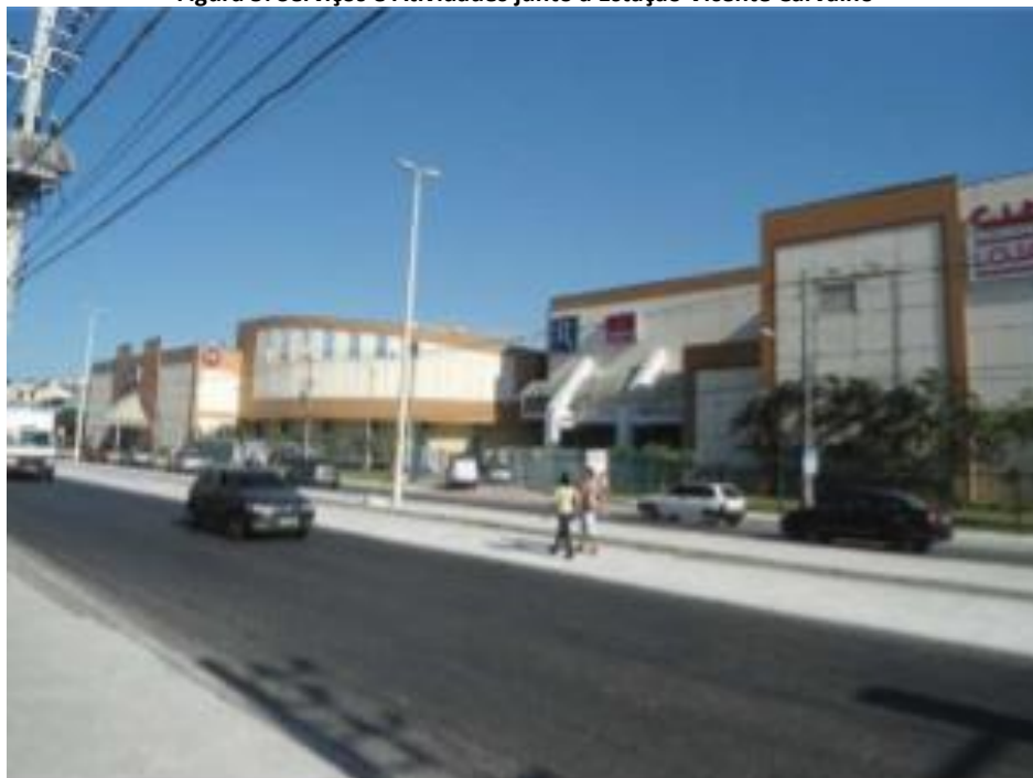
Figura 5: Serviços e Atividades junto à Estação Vicente Carvalho