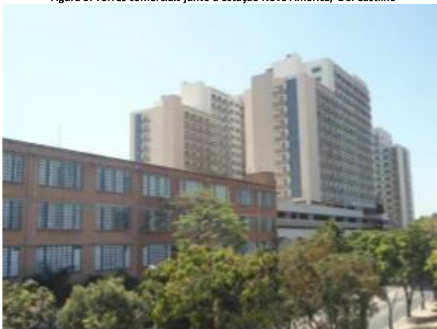
Figura 3: Torres comerciais junto à estação Nova América/ Del Castilho