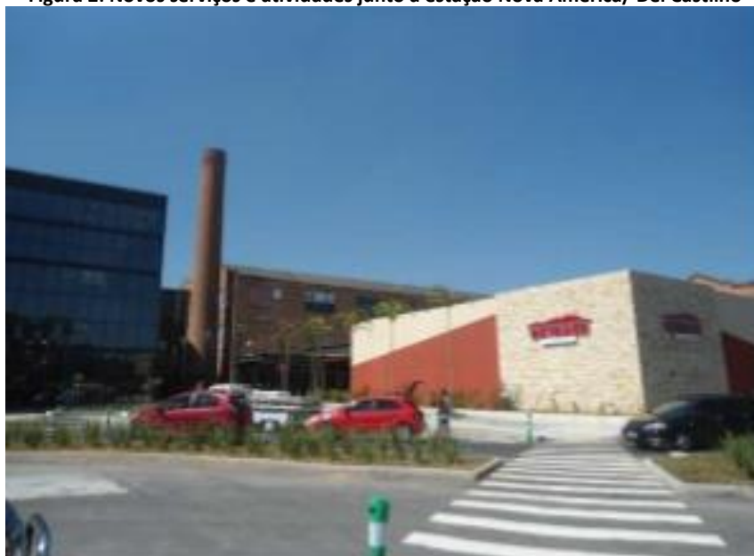
Figura 2: Novos serviços e atividades junto à estação Nova América/ Del Castilho

No raio de aproximadamente 500 metros próximo às saídas das estações foram os locais mais beneficiados com investimentos do setor imobiliário e do comercial (Figura 2, 3, 4 e 5), investimentos que não vêm de hoje.