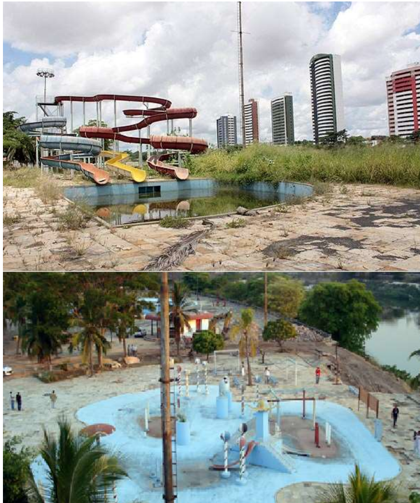
Figura 3: As condições do parque potycabana após seu desuso