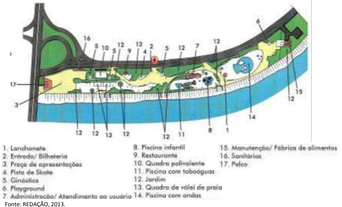
Figura 2: Projeto original da Potycabana

Analisando a figura 2 é possível observar que o parque apresentava vários equipamentos de lazer para o público, o que o tornava bastante atrativo. Após a falência da COBEL, em 2001, o parque passou para o sistema Fecomércio/Sesc/Senac. No entanto, pelo fato desse processo não ter sido tramitado na assembleia legislativa estadual, o mesmo foi anulado em 2006, voltando a ser administrado pelo estado. Em 2008 houve a destinação de verba do estado para a recuperação do local. Em 2009 deram a previsão de entrega do parque em 180 dias, a princípio essa obra seria de recuperação do local e sua função continuaria a mesma (AFONSO, 2010).