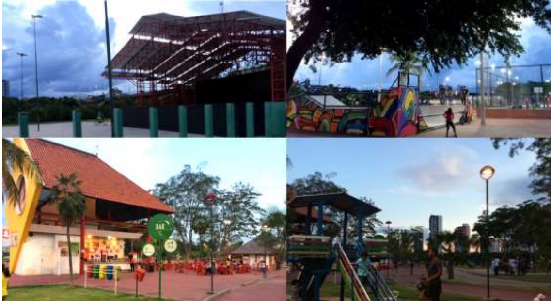
Figura 5: Alguns equipamentos do parque disponíveis ao público