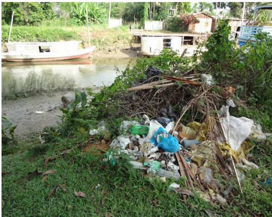
Figuras 3 e 4 – acúmulo de lixo que podem ocasionar sérios problemas relacionados à saúde.

No que diz respeito à saúde, a população sofre pela falta do saneamento básico e com a poluição existente no canal, o que ocasiona doenças endêmicas. A poluição no canal só tende a aumentar já que muitos resíduos oriundos da madeira são jogados no local, juntamente com os dejetos sanitários e muitas vezes o lixo diário (figuras 3 e 4).