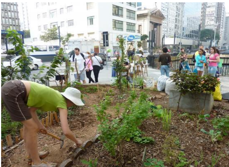
Figura 3. Agricultura urbana em São Paulo, Brasil.